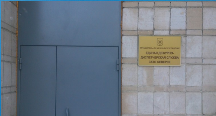
Здание администрации ЗАТО г. Северск

ЕДДС ЗАТО Северск Томской области размещена в отдельном здании.