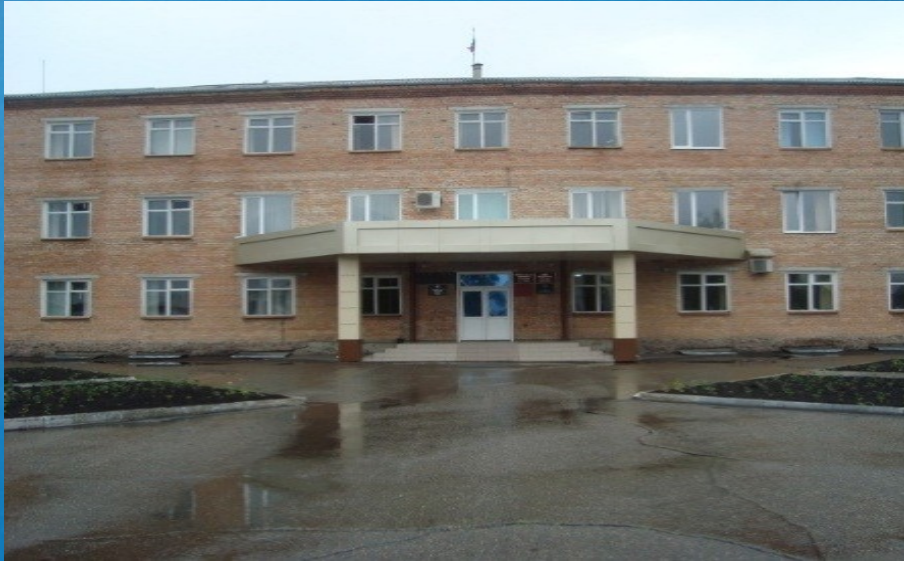
Здание Управления по делам ГО и ЧС Администрации Зырянского муниципального района

ЕДДС муниципального района создана в составе отдела оперативных дежурных, входящего в штат Управления по делам ГО и ЧС Администрации Зырянского муниципального района Площадь зала ОДС – 24,0 кв. м.